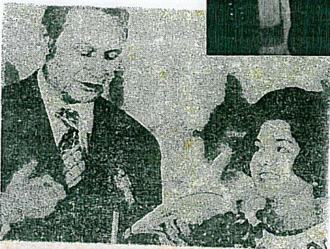
Festivalul toamnei '75 : Trese noi pe galoanele prestigi- ui artistic PAG. A VI-A